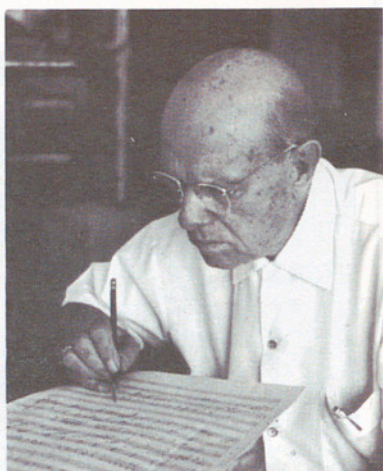
Pablo Casals, Compositor