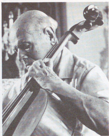
Pablo Casals, Cellista