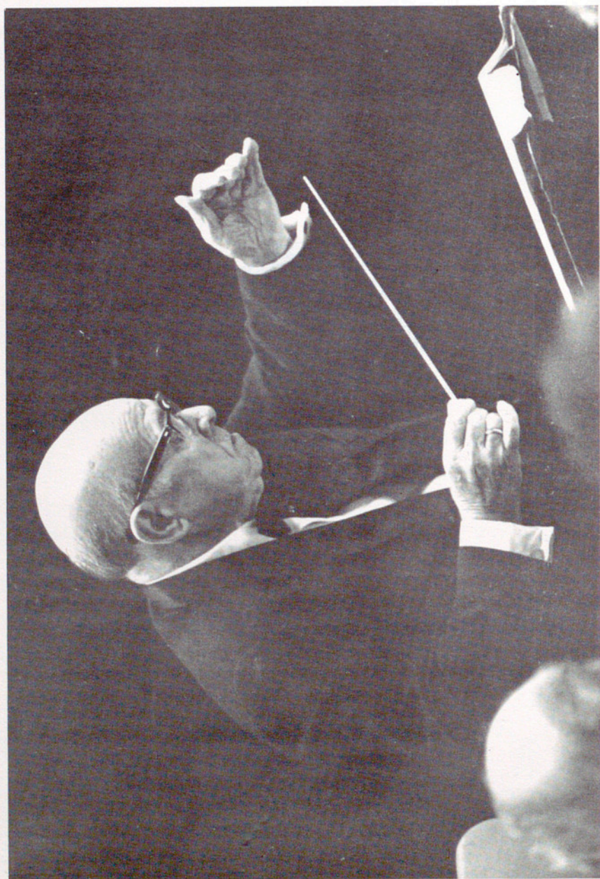
Pablo Casals, Director