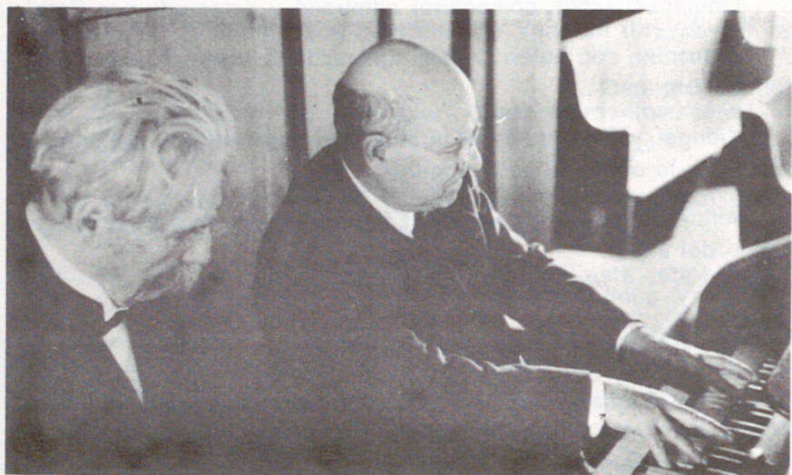
Albert Schweitzer y Casals

A los 18 años, Casals entra en la intimidad que le brinda en su casa el Conde Morphy... Todas las mañanas el joven llama a la puerta del palacete que el Conde tiene en el aristocrático barrio de Argüelles. Se siente feliz en aquella casa junto a aquel hombre que le brinda su afecto y protección.