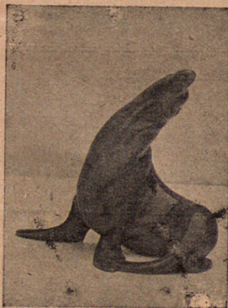
l'admirable realisme de les porcel- lanes de Co- penhague