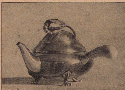
les sublimes creacions en argent del mestre danès GEORG JENSEN